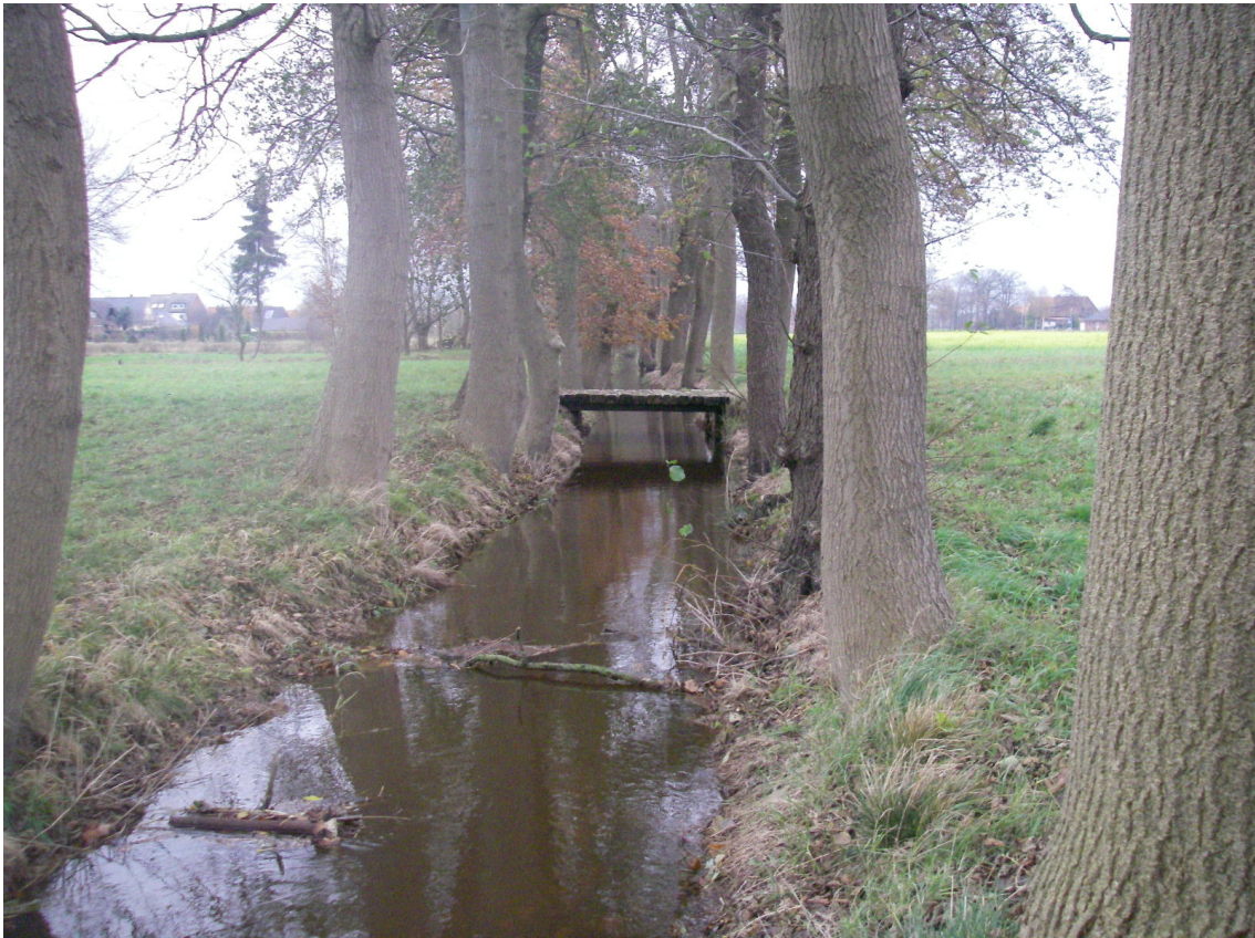
Abbildung 4: Gewässer Gänsebach mit typischem Baumbestand

Die resultierenden Überschwemmungsflächen erreichen jedoch nicht die Gebäude. Die Flächen breiten sich beidseitig lediglich zwischen 20 m und 50 m vom Gewässer aus. Zu beachten sind die Rückstauprozesse an den Brückenbauwerken an den Straßen „Am Angelser Feld“, „Alte Poststraße“ und „Mühlenkamp“. An allen Bauwerken kommt es im stationären HQ100-Fall zu Straßenüberschwemmungen, die aber nicht zu großflächigen Überschwemmungen führen. Nur direkt oberhalb des „Mühlenkamp“ liegen einzelne Gebäude innerhalb der Wasserfläche. Im vom Unterwasser beeinflussten Mündungsbereich liegen links- und rechtsseitig des Gänsebachs vereinzelte Gebäude im Bereich der Überschwemmungsflächen.