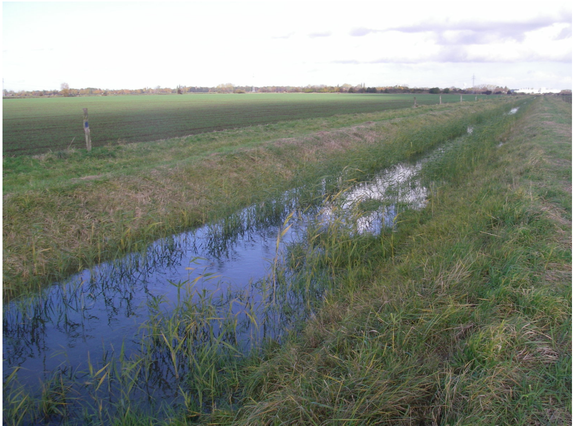
Abbildung 6: Unterlauf des Weyher Bruchgrabens mit Blick auf Überschwemmungsflächen der Ochtum

Zu beachten ist der Einfluss des Unterwasserstandes auf den Wasserstand des Weyher Bruchgrabens. Die sich ergebenden Überschwemmungsflächen beidseitig der unteren 1.500 m sind dem Vorlandabfluss der Ochtum und somit dessen Überschwemmungsfläche zuzuschreiben. Die Karten 70.4.3 (Wassertiefenkarte) und 70.5.3 (Überschwemmungsgebiet) zeigen die Flächen bis zum Modellrand.