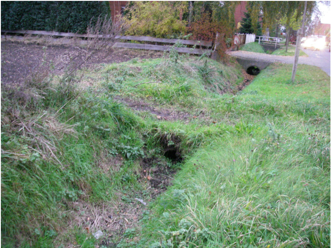
Abbildung 5: Gewässer Weyher Bruchgraben im Bereich Böttchereistraße

Der Berechnungsbereich des Weyher Bruchgrabens reicht von der Mündung in die Ochtum bis zum Teich „Großes Moor“ südlich der Ortschaft Leeste. Das gehäufte Aufkommen von Durchlassbauwerken hat erheblichen Einfluss auf die hydraulischen Gegebenheiten und wurde somit im Datensatz integriert. Allein an der Böttchereistraße liegen auf 1,5 km Länge 31 Durchlassbauwerke, von denen die meisten Rohrdurchlässe DN500 bis DN1200 sind. Die Vermessung hat ergeben, dass die meisten dieser Durchlässe erheblich verschlammt oder verkrautet sind (vgl. Abbildung 5), so dass hydraulisch nicht mit dem vollen Querschnitt gerechnet werden kann, um den Ist-Zustand zu simulieren. Stattdessen wurden die Bauwerke mittels anderer Formen wie Ellipse oder Maulprofil eingegeben, um die aktuellen hydraulisch wirksamen Querschnittsabmessungen wiederzugeben.