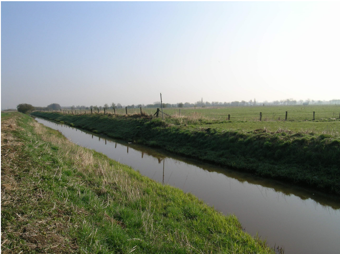
Abbildung 3: tiefer Bereich des rechtsseitigen Ufers

Der Berechnungsbereich reicht von der Mündung in die Ochtum bis zur B322 westlich von Seckenhausen. Die Besonderheit liegt im Bereich der Ortschaft Brinkum, wo der Stuhrgraben unter der Autobahn A1 durchgeführt wird. Die geodätische Höhe der Straße führt zu einer Teilung der Überschwemmungsflächen in ober- und unterhalb der Autobahn.